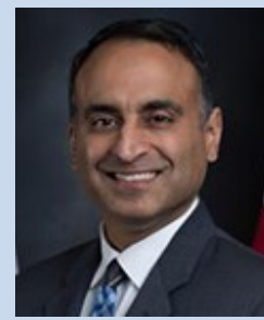
Ash Kalra Asambleísta